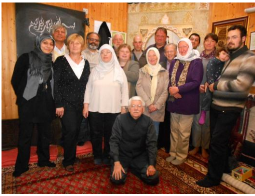
Mitglieder der DML in der Vereinsmoschee in Hamburg