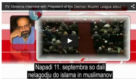
Fernseh-Interview des slowenischen Fernsehens mit dem Vorsitzenden der Deutschen Muslim Liga über Islamfeindlichkeit und Extremismus.